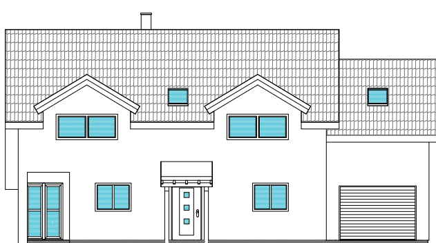
Rodinný dům dle individuálního projektu